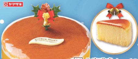
14 北海道産チーズの スプレケーキ (直径約15cm) (本数) 1,780円 (税込 1,929円)

タルト生地、にアモンド生地、カスタードクリームを重ね、 ラズベリーとブルーベリーの果と、ラズベリー& ストロベリーコンフィチュールをみずみずしく仕上げました。