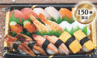
28 クリスマスにぎり寿司盛合せ(2人前) マグロ・ぶり・サーモン・いわし・鰻・ イサ・重み・穴子・カニカマ・玉子 (税込 1,980円) (税込 2,139円)