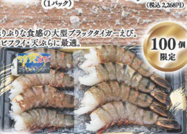
33 冷凍ブラックタイガーえび特大 冷凍ブラックタイガーえび特大 (8尾入) (税込 1,580円) (税込 1,707円)