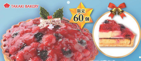
12 濃厚ベリーの Xmasタルト (直径約15cm) (本数) 3,480円 (税込 3,799円)

チョコレンドクリームやキャラメルクリーム、 チョコレンドがけのフリンジアイスをココア生地 でサンドしました。仕上げは「森」をイメージして立体的に。 子ども大人とワクワクするチョコレンドケーキです。