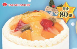
11 彩りフルーツの ショートケーキ (直径約15cm) (本数) 3,480円 (税込 3,799円)

ココアスポンジにキャラメルクリームと ガナッシュクリームをサンドした ブッシュ・ド・ノエルです。