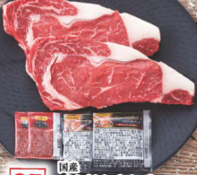
35 国産 味匠黒毛和牛 ロースステーキ用 (2枚・約350g) (税込 2,980円) (税込 3,219円)