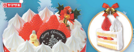
15 クリスマス 生ケーキ5号 (直径約15cm) (本数) 2,980円 (税込 3,219円)

北海道産100%のクリームチーズとマスカルポーネを 使用し、食感や味合いの異なる2層のおいしさを重ねた、 とっておきのチーズケーキです。