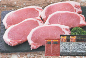
37 国産 厚切!やまと豚 ロースステーキ用 (6枚入・約900g) (税込 1,980円) (税込 2,139円)