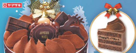
16 クリスマス 生チョコケーキ5号 (直径約15cm) (本数) 2,980円 (税込 3,219円)

板チョコ・アモンドチョコ・マカダミアアーモンドチョコを トッピングしたチョコぐししのクリスマスケーキです。