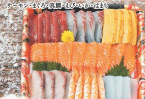
31 アトランティックサーモンたっぷり 手巻き寿司 ネタセット(約3人前) (税込 1,980円) (税込 2,139円)