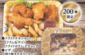
29 フライドチキン& ピザセット(1パック) フライドチキンセット (ドナト&サイ)・ フライドポテト・ケチャップ・ ピザ・ 照り焼きチキン・コーン (税込 1,980円) (税込 2,139円)