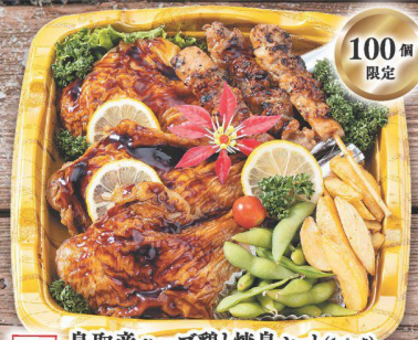
26 鳥取産ハーブ鶏と焼鳥セット(1パック) ローストチキン(鳥取産ハーブ鶏使用)・ 焼き鳥(モモ)・フライドポテト・枝豆・ ミニトマト・レモン・グリーンパセリ (税込 2,980円) (税込 3,219円)

●ご予約締切日/12月15日(金)まで ●商品お渡し日/12月22日(金)・23日(土)・24日(日)・25日(月)