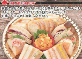
30 クリスマス リースサンド(1パック) お渡し日/12月23日(土)・24日(日)・25日(月)限定 (税込 2,100円) (税込 2,268円)