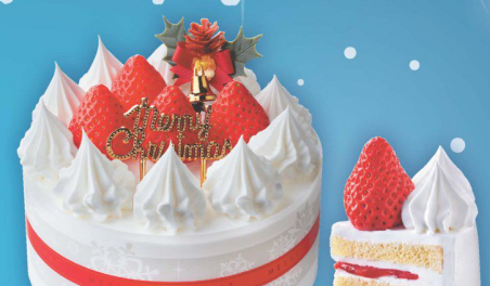
18 糖質を抑えた 苺のケーキ4号 (直径約13cm) (本数) 2,280円 (税込 2,469円)

北海道産チーズを使用した ベイクドチーズ・チーズムース・ マスカルポーネチーズクリームを 使用し、3つの食感を味わえる チーズケーキです。