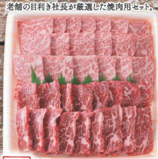
36 国産 味匠黒毛和牛焼肉セット (肩ロース 200g×10パック 200g) (約400g) (税込 2,980円) (税込 3,219円)