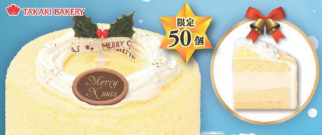
13 2層の チーズケーキ (直径約12cm) (本数) 2,480円 (税込 2,679円)

6種類のフルーツ(砂糖漬けいちご、黄桃、オレンジ、 キウイ、洋ナシ、パイナップル)をごちそうと盛り付けた。 家族みんなで楽しめるクリスマスケーキです。 ※冷凍いちごを砂糖漬けにして使用しているため、 通常の生いちごとは食感・味が異なりますので ご了承ください。