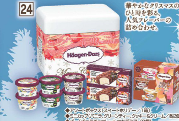
24 ハーゲンダッツ クリスマスデイクアウト ギフトセット (6個) 4,680円 (税込 5,059円)

商品をご注文の際はご予約申込書にご記入下さいませ。 掲載の商品は「卵」、「乳製品」、「小麦」のアレルギ物質を含みます。