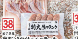
38 岩手県産 南部どり骨付モモステーキ・ やまと豚生フランク(冷凍)セット (1セット) (税込 2,480円) (税込 2,679円)