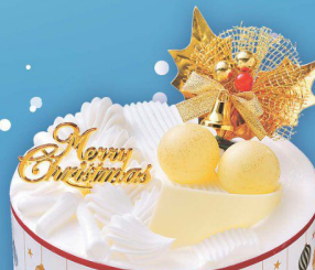
19 トリプルチーズケーキ4号 (北海道産チーズ使用) (直径約13cm) (本数) 2,800円 (税込 3,024円)

6種類の味が楽しめるパーティーにぴったりのクリスマス ケーキです。(生ショート2個、チョコケーキ2個、 マロンケーキ1個、スフレケーキ1個、ストロベリーと ラズベリーのケーキ1個、抹茶のムースケーキ1個)