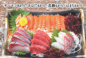
32 アトランティックサーモンたっぷり 刺身盛合せ (約3人前) (税込 1,580円) (税込 1,707円)