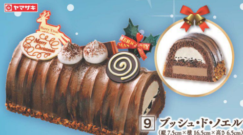
9 ブッシュ・ド・ノエル (縦7.5cm×横16.5cm×高さ6.5cm) (本数) 2,980円 (税込 3,219円)

ココアスポンジにキャラメルクリームと ガナッシュクリームをサンドした ブッシュ・ド・ノエルです。