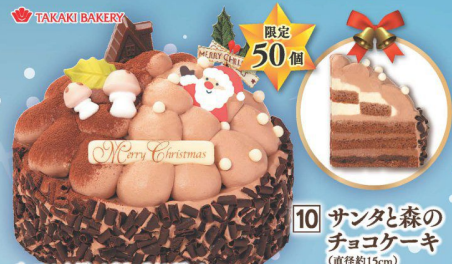
10 サンタと森の チョコケーキ (直径約15cm) (本数) 3,480円 (税込 3,799円)

チョコレンドクリームやキャラメルクリーム、 チョコレンドがけのフリンジアイスをココア生地 でサンドしました。仕上げは「森」をイメージして立体的に。 子ども大人とワクワクするチョコレンドケーキです。