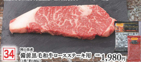
34 岡山県産 備前黒毛和牛ロースステーキ用 (1枚・約180g) (税込 1,980円) (税込 2,139円)