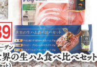
39 ブリテン 世界の生ハム食べ比べセット (1セット) やまと豚生ハム50g・アメリカ産ホルビーブッシュ40g・ スペイン産エスパーニャ・ニハル・ニハル・40g・ EXバージョン オリーブオイル20ml (税込 1,880円) (税込 2,039円)