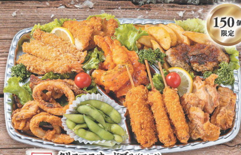
27 クリスマスオードブル(1パック) フライドチキン・フライドエビ・揚げ揚げ・枝豆・ 豚玉ねぎ串揚げ・から揚げ・トマト・レモン・グリーンパセリ・ フライドポテト・ハンバーガー・デミタラソース・海老サリ (税込 1,980円) (税込 2,139円)