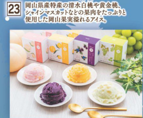
23 フルーツ・ジャム 果実ごろごろアイス 6個セット (本数) 3,000円 (税込 3,240円)

商品をご注文の際はご予約申込書にご記入下さいませ。 掲載の商品は「卵」、「乳製品」、「小麦」のアレルギ物質を含みます。