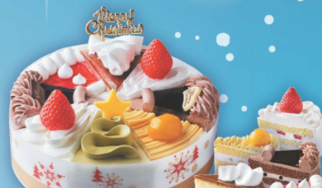
17 クリスマスショートケーキ 詰合せ (直径約18cm) (本数) 3,280円 (税込 3,549円)

板チョコ・アモンドチョコ・マカダミアアーモンドチョコを トッピングしたチョコぐししのクリスマスケーキです。