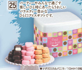
25 パーティー 生チョコケーキ5号 (直径約15cm) (本数) 2,980円 (税込 3,219円)